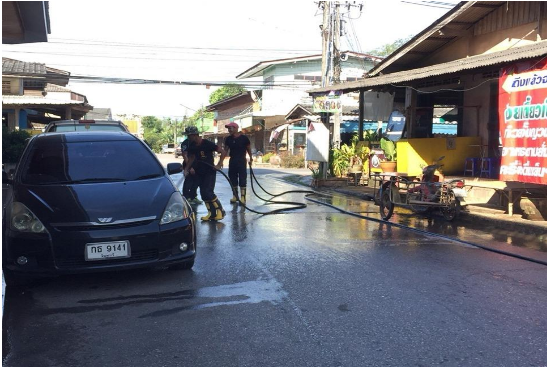
โครงการป้องกันและควบคุมโรคไข้เลือดออก