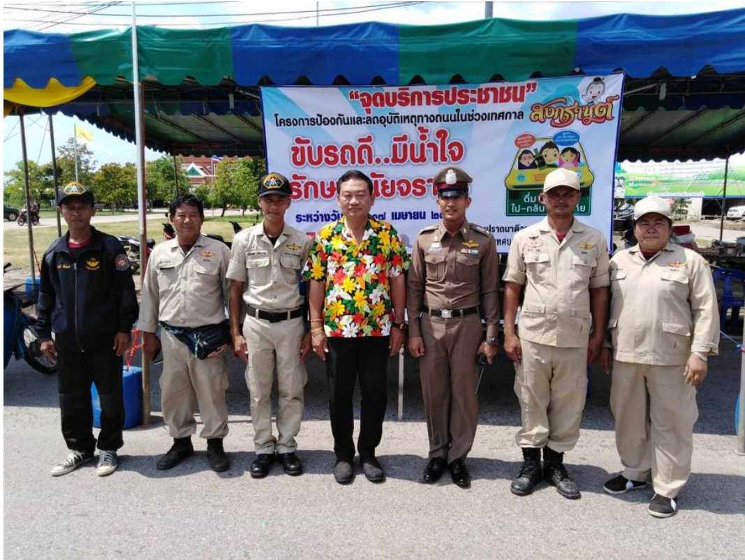
จุดตรวจ 7 วันอันตรายช่วงเทศกาลวันขึ้นปีใหม่